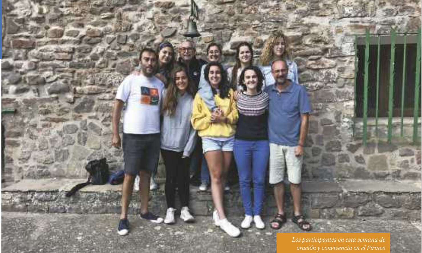
Los participantes en esta semana de oración y convivencia en el Pirineo