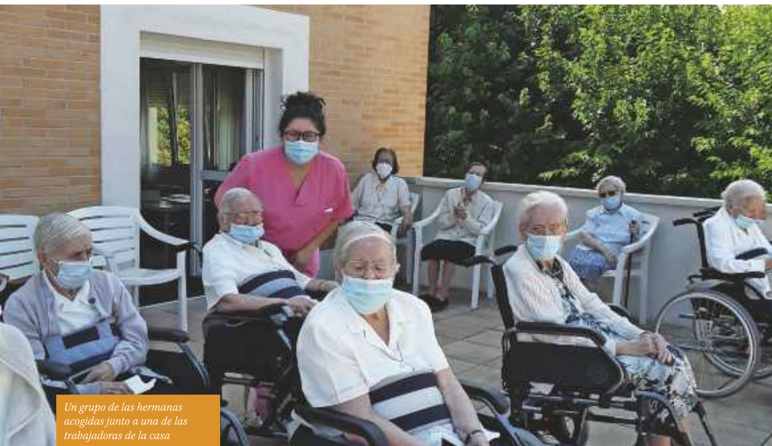
Un grupo de las hermanas acogidas junto a una de las trabajadoras de la casa

Pero los teléfonos no han parado de sonar, y este año, todas las jubilaires