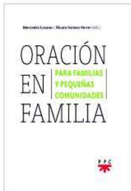
Mercedes Lozano Álvaro Gómez-Ferrer (eds.)