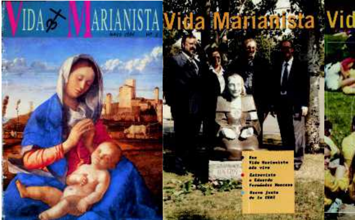
Portadas de los número 1, 19, 52, 65 y 99 de Vida marianista