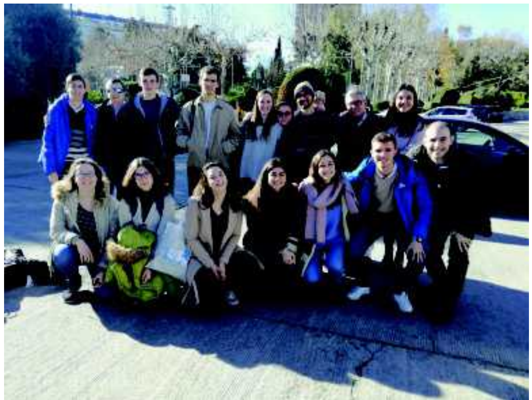
Jóvenes marianistas de Santa María del Pilar participantes en el encuentro.

El esquema del encuentro es sencillo: por la mañana,