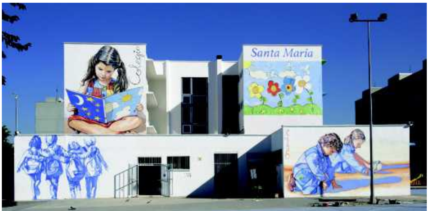
Vista general de los murales en el colegio Santa María de Orcasitas