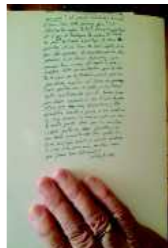
Carta de la Masdre Adela.

En el momento más festivo del encuentro, la Eucaristía, se presentaron en el ofertorio esos mensajes. Así pudimos