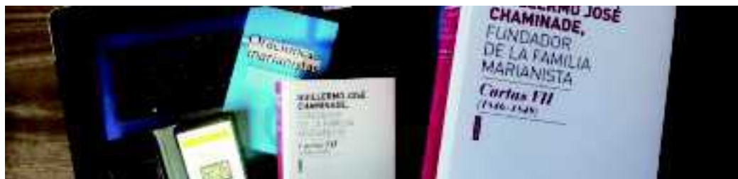
Biblioteca digital marianista

EL SERVICIO DE PUBLICACIONES MARIANISTAS (SPM) HA INICIADO UNA FORMA NUEVA DE EDICIÓN CON LAS PUBLICACIONES DIGITALES.