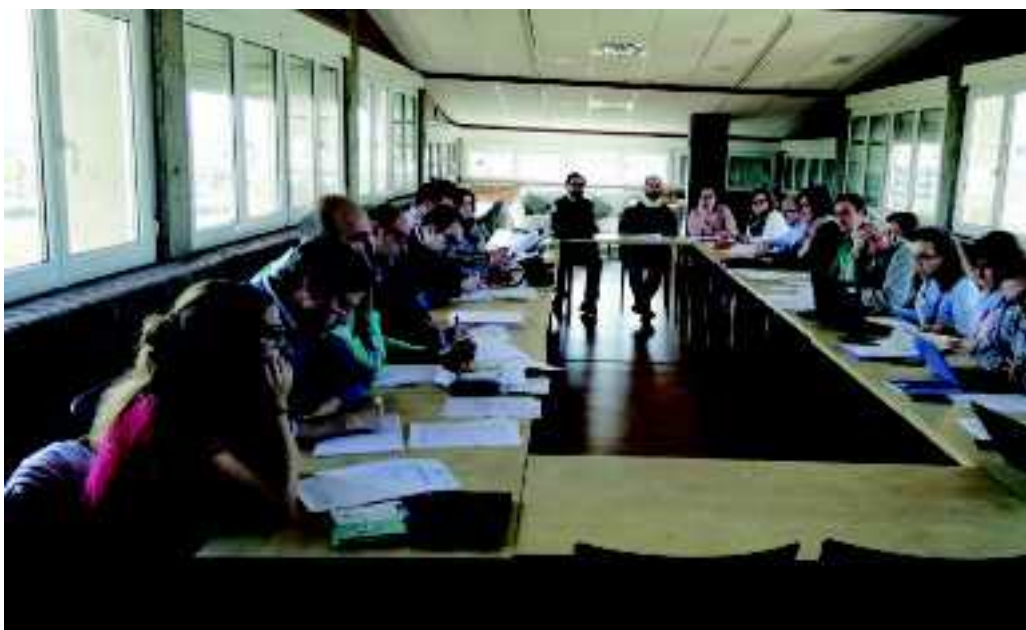
Miembros del Consejo interprovincial en la pasada reunión en Zaragoza

Hace años que las Fraternidades de Madrid y Zaragoza comparten misión, trabajo y sueños, por ejemplo en el Consejo de la Familia marianista de España, del que dependen obras como Ágora marianista (portal web de la Familia marianista de España) o en el Patronato de Acción marianista (la ONGd de la Familia). Así, esta primera reunión del Consejo interprovincial de Fraternidades Zaragoza-Madrid es un paso más dentro del proceso de aproximación, conocimiento mutuo y trabajo compartido en el plano institucional entre las diferentes ramas que forman la Familia marianista de España.