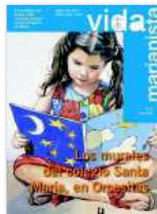
PORTADA: Los murales del colegio Santa María, en Orcasitas