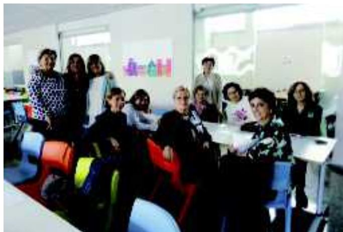
Participantes en el encuentro de Alboraya

Ella misma nos enviaba junto con toda la Iglesia a "anunciar a todo el mundo el Reino de Dios".