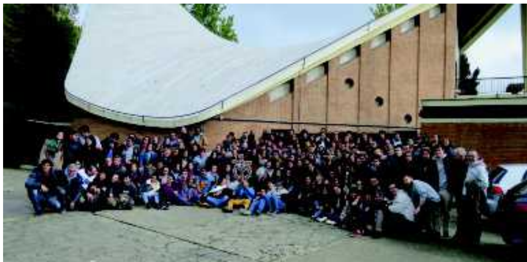
Participantes en la Asamblea Guinomai

En esta breve crónica los actos siguientes: la velada del viernes por la noche, que sirvió de divertido encuentro; el sábado por la mañana echamos una mirada al pasado, al presente y al futuro de lo que es Guinomai ; tras la comida y una yincana en