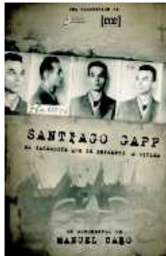
Cartel anunciador del documental sobre Santiago Gapp

La difusión de este documental es una oportunidad de acercarse a este mártir de la fe y de enriquecernos con su testimonio.