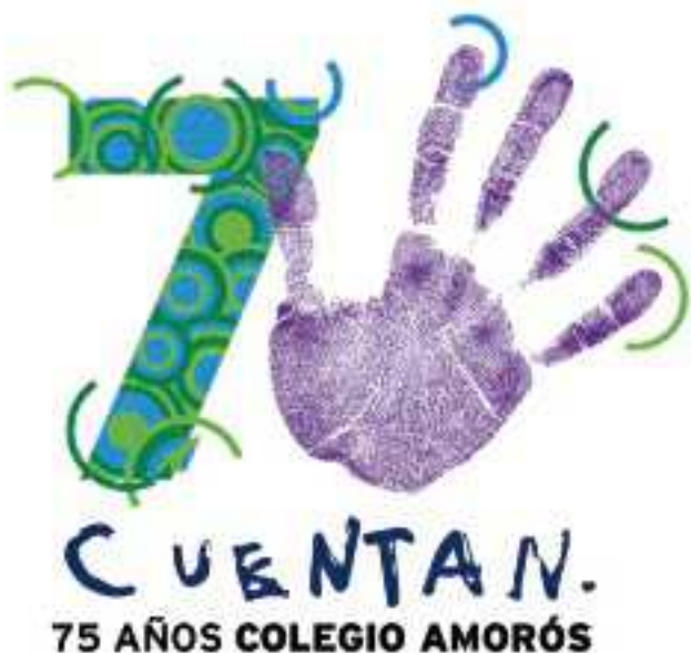
Logo del 75 aniversario

En ese celebrar habrá actos, acontecimientos, reuniones, debates, foros, fotos, internet, streaming, voceros, antiguos alumnos, alumnos actuales, madres, padres, vivos, muertos, concursos, éxitos y fracasos, según el folleto que se adjunta. Pero todo dentro de ese pentágono irregular que Manuel José de Negrete y de la Torre formó para alojar un sueño del que hoy ya participan miles de soñadores: el sueño de la ilustración.