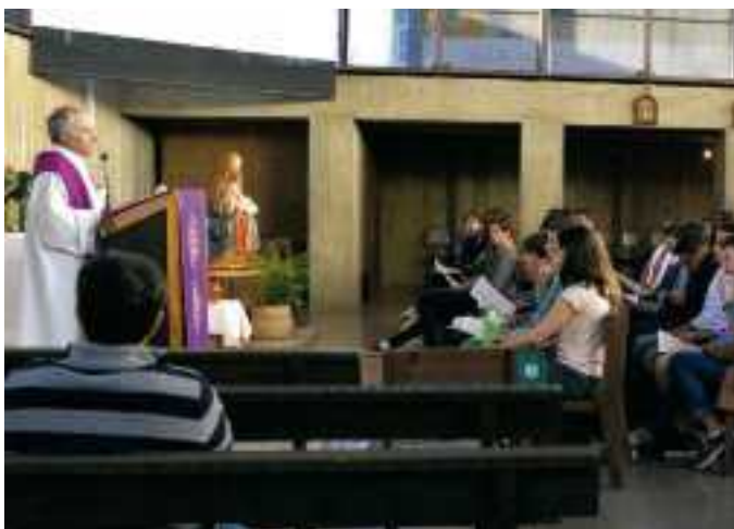
Jóvenes participantes en las jornadas de preparación del Sínodo

El Sínodo nos va a abrir una puerta nueva a seguir compartiendo con nuestros jóvenes la aventura de vivir y transmitir el Evangelio de Jesús.