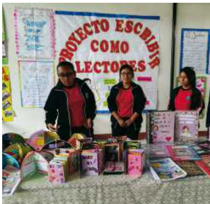
Jóvenes participantes en EcL en Perú.

Una peculiaridad que ha permitido el éxito de EcL es su adaptabilidad a diversas edades –desde los primeros lectores hasta adolescentes– y contextos distintos en regiones y países, desde ámbitos rurales (como el campo de Querétaro