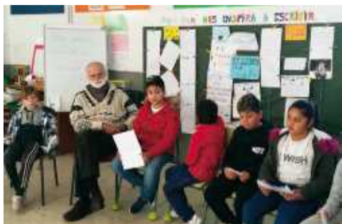
El escritor Gonzalo Moure en un aula en Plasencia (España).

La Fundación SM y AELE continúan expandiendo EcL por toda Iberoamérica para que, a través de este programa, desde distintas instancias, la literatura se integre en los escenarios cotidianos de niños y jóvenes como un discurso cultural que atraviesa y modela la identidad personal. Durante el 2019 celebraremos los 10 años de implantación en Argentina y Chile.