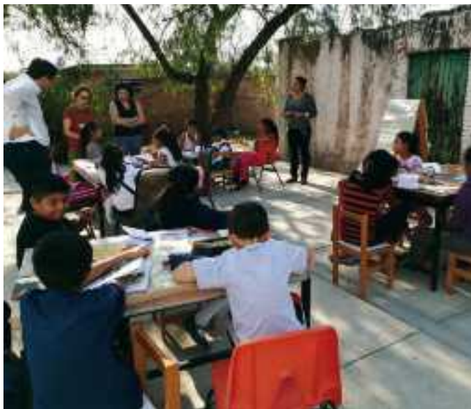
Biblioteca participante en EcL en Tequisquiapan (Querétaro), México.

En EcL pretendemos que los chicos y chicas generen ideas, sentimientos y experiencias a partir del acercamiento a la literatura y sean capaces de expresarlos