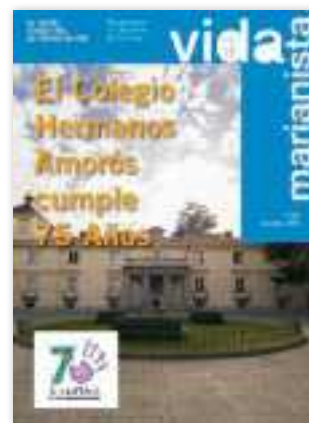
PORTADA: El Colegio Hermanos Amorós cumple 75 años

Traemos también a nuestras páginas un exitoso programa iberoamericano de la Fundación SM, que celebra ya 10 años desde su implantación: Escribir como Lectores , un programa de animación a la lectoescritura, en el que los chicos y chicas se sienten al mismo tiempo lectores y escritores de una obra literaria. El objetivo inicial, y que hoy sigue impulsando el proyecto, es realizar intervenciones en escuelas iberoamericanas para promover prácticas de lectura y escritura de una obra literaria publicada por SM.