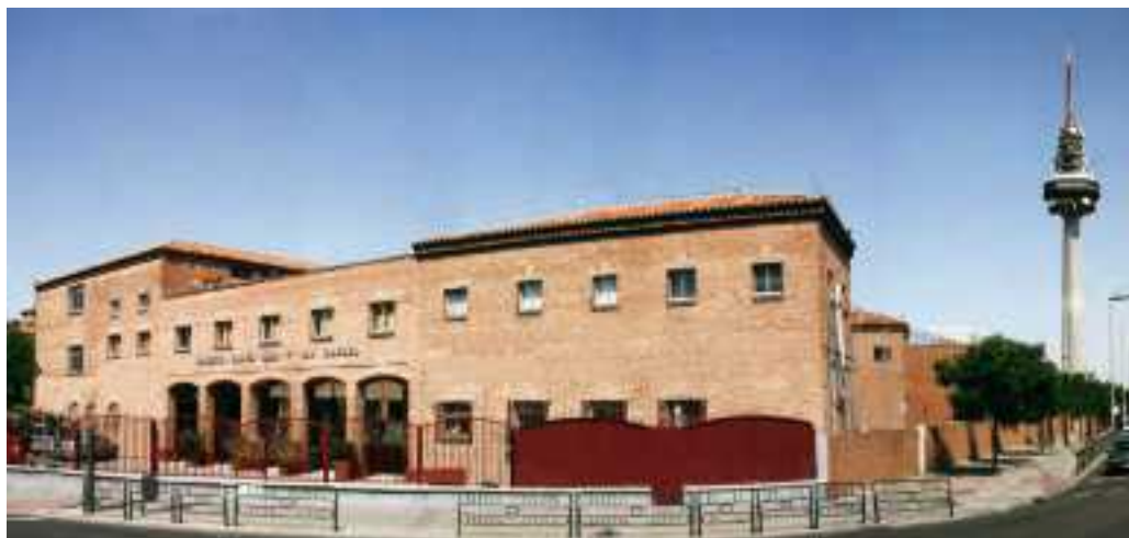
Fachada del colegio.

Además de lo anteriormente mencionado con la FEMDL, este año hemos iniciado lo que se llama Recreación de la escuela marianista (REM),