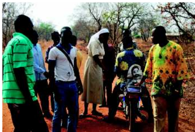
Acción Marianista apoya proyectos que implican a las comunidades destinatarias. (Proyecto en África).

Desde los inicios en 2010 hemos apoyado 130 proyectos de 12 países. El total de apoyo económico con el que la Fundación Acción Marianista ha podido contribuir en sus primeros seis años de labor ha sido de 1.550.000 euros.