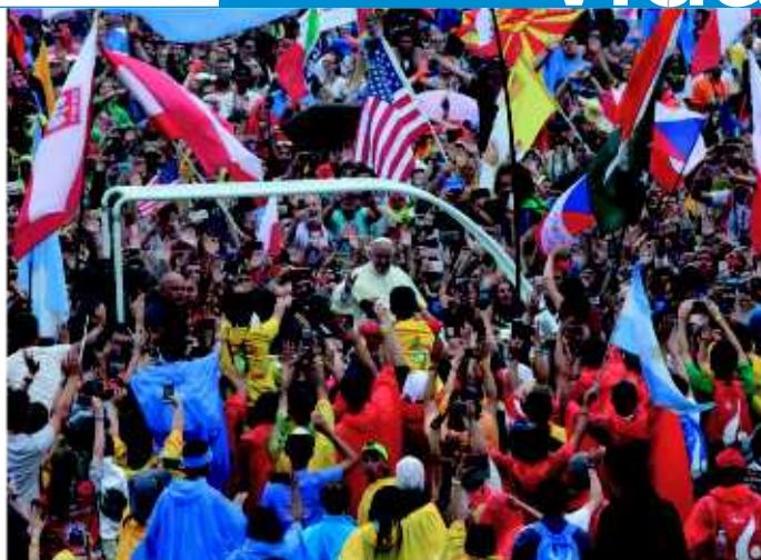
Llegada del Papa Francisco a Cracovia.

Las mañanas de la JMJ se iniciaban con las catequesis y la eucaristías, que según los distintos idiomas, eran impartidas por obispos de todo el mundo en las iglesias de la ciudad. Después, se podía optar por participar en cualquiera de la infinidad de actividades culturales o religiosas que se ofrecían: conciertos, charlas, oraciones, exposiciones, recibir el sacramento del perdón... Tras conseguir algo de comer, que no siempre era fácil, llegaba el