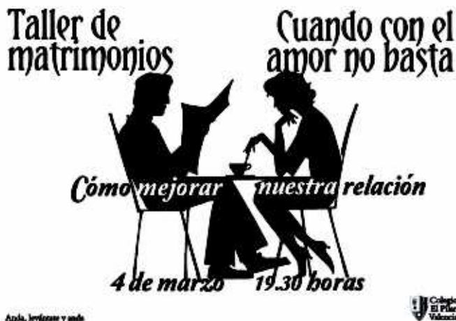
Taller de la Pastoral Familiar.

Aprovecho para contar lo que para mí ha sido y sigue siendo colaborar en la pastoral familiar: una gran oportunidad para dar gratis lo que gratis he recibido. Vivir la fe es el mayor regalo que la vida me ha dado y poder transmitir eso a otros padres es una maravilla. Y siento que el Espíritu nos ha ido acompañando durante estos años, dándonos luz y fuer-