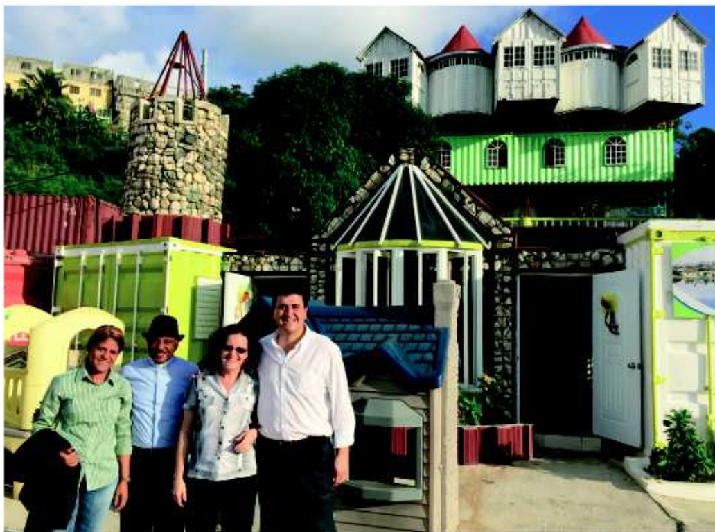
Visitando el proyecto apoyado por la Fsm “Vida sobre el Ozama”, en República Dominicana.

Sueño con un voluntariado corporativo para todos los profesionales de SM en el mundo que les acerque a experiencias de servicio en sus países o en otros lugares, que les haga mejorar como personas.