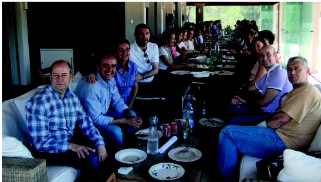
Reunión de enlaces de Pastoral Familiar.

HACE APROXIMADAMENTE DIEZ AÑOS COMENZAMOS EN EL COLEGIO DE NUESTRA SEÑORA DEL PILAR DE VALENCIA NUESTRO RECORRIDO EN LA PASTORAL FAMILIAR.