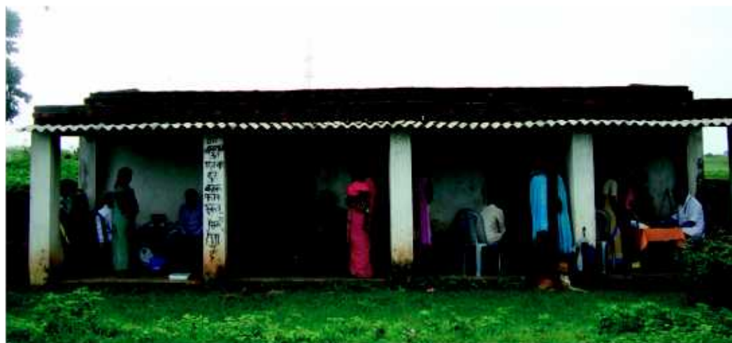
Dispensario médico en Singhpur (India) apoyado por AM.

Las aportaciones se dirigirán de manera prioritaria a apoyar proyectos de naturaleza educativa, sanitaria o de promoción socioeducativa, contemplando también la financiación de infraestructuras destinadas a proyectos de la naturaleza indicada.