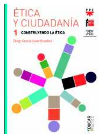
D. GRACIA, D. (coord.), Ética y ciudadanía . Madrid, PPC, 2016, Volumen I: Construyendo la ética , 310 páginas; Deliberando sobre valores , 208 páginas.

lítica, el derecho, la economía, la bioética, el medio ambiente, los medios de comunicación y la educación (bloque 5). Es un gran mérito de esta obra haber combinado un gran rigor de pensamiento con una presentación pedagógica y amena: cada tema comienza con una narración y culmina con numerosas actividades. Reconociendo lo árido del tema en sí, pensamos que es una obra útil e interesante, no solo para profesores de ética, sino para todo creyente preocupado por la formación integral propia y ajena, sobre todo la de las generaciones más jóvenes.