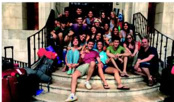
Participantes en el programa CAS en Valencia.

Y por la noche, Amar: con la satisfacción del servicio y la inquietud por conocer más, establecimos un espacio de interioridad, de espiritualidad, de encajar todo lo sucedido y pasarlo por el corazón. Diferentes oraciones facilitaban el