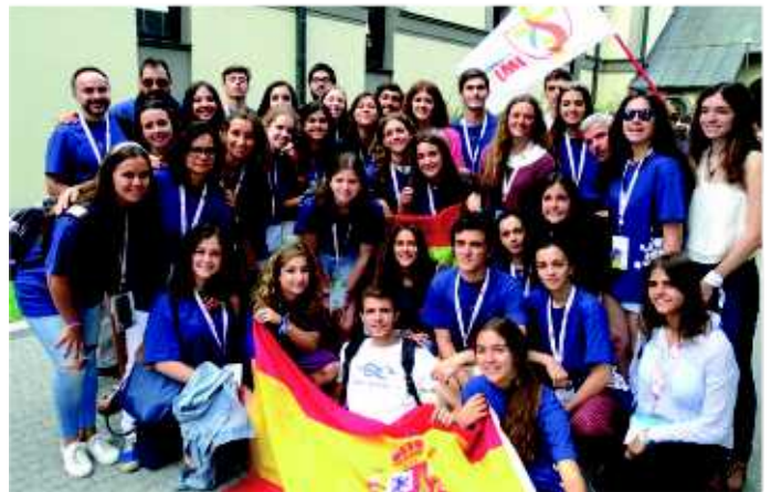
Grupo de jóvenes marianistas participantes en la JMJ.

reto vivir con generosidad y alegría todo este trabajo. Sin duda, esta experiencia les ayudará a afrontar nuevos retos misioneros y pastorales. La parroquia de Piastów, y los sacerdotes que la dirigen, han podido poner en valor la presencia dinamizadora de las dos fraternidades marianistas y el valor del laicado en su responsabilidad misionera compartida.