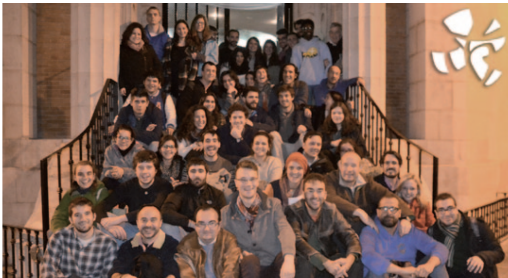
Jóvenes de la Familia marianistas participantes en el encuentro.

Hemos podido ver la gran familia cristiana sin diferencias, sin reparos, sin lenguas y sin colores. Una única iglesia peregrinando en una misma dirección, iluminados por la misma luz.