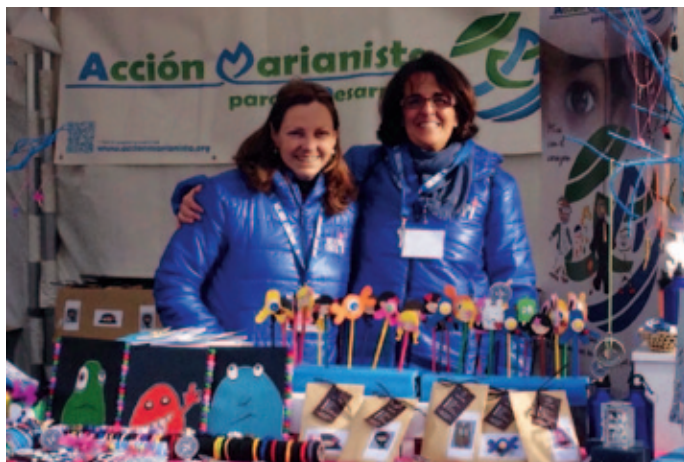
Tienda de Acción marianista en la Olimpiada solidaria.

Hay que decir también que desde ese principio esta Delegación acogió el lema olímpico propuesto y lo trasladó como un mantra dentro y fuera de