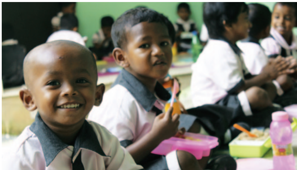
Niños en la escuela de Ranchi (India).

Para las actividades escolares es preciso contar con medios materiales, al menos unos mínimos que garanticen la continuidad de los alumnos y especialmente de las alumnas (pues son ellas las que tienen un mayor porcentaje de abandono escolar, debido a condicionantes sociales, culturales y familiares), por las que estamos especialmente sensibilizados en Acción marianista. De este modo, en 2016 vamos a colaborar con obras de mejora y acondicionamiento de los internados de colegios de Benín y Togo, de la residencia de niñas en Singhpur (India) y de material para las aulas (bancos y mesas de madera) del colegio Adela de Kara, en Togo.