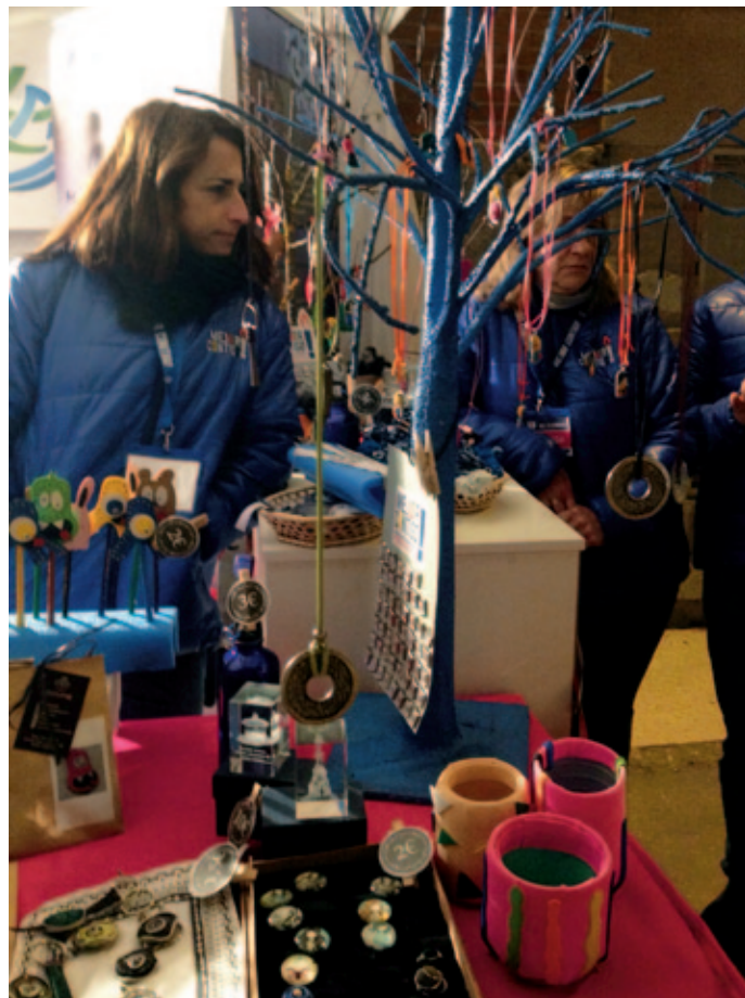
Voluntarios de Acción marianista en Vitoria.

¿Os atrevéis a soñar conmigo?, le podríamos llamar "Proyecto ..." y trabajar juntos por hacerlo realidad.