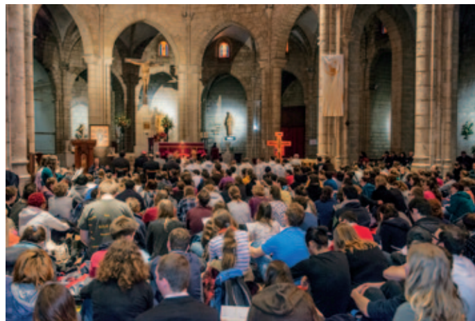
Oración en la catedral de Valencia.

Abrir la vida a lo inesperado, sentirte parte de la gran familia humana, orar junto a cristianos de otras iglesias, buscar juntos la comunión que construya la paz y la solidaridad entre los pueblos, y el compromiso de ser cada uno, en nuestra vida diaria, un signo del Dios de la misericordia, son algunos de los frutos.