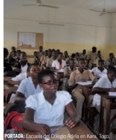
PORTADA: Escuela del Colegio Adela en Kara, Togo.