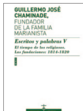
GUILLERMO JOSÉ CHAMINADE, Escritos y Palabras, V El tiempo de los Religiosos: las fundaciones (1814-1820) . Madrid, SPM, 2015, 816 páginas.

sistema de virtudes o del método de oración. Cuando se superan las barreras del lenguaje y una cierta teología de la vida religiosa ya obsoleta y aún deudora del jansenismo, la lectura de estos documentos permite recuperar lo mejor de la idea chaminadiana de la vida religiosa.