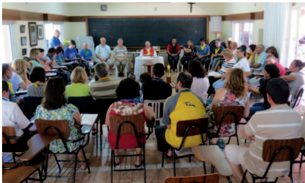
Celebración de la eucaristía en una de las comunidades brasileñas