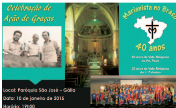
Invitación a la misa de acción de gracias.

La Familia marianista está encarnada en la fe y en la sensibilidad de la gente brasileña. Son siete comunidades de laicos con unos ochenta miembros. El carisma marianista tiene colores brasileños: el verde de la esperanza, el amarillo de la alegría y el azul de este horizonte inagotable.