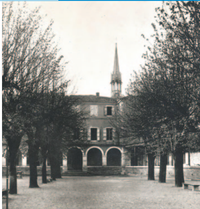
La fundación de Agen