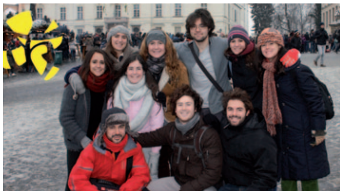
Miembros de la Familia marianista en el último encuentro de Taizé en Praga.

Los encuentros europeos se dirigen principalmente a jóvenes y personas adultas de entre 17 y 35 años. Son jóvenes que pertenecen a distintas iglesias cristianas, algunos creyentes y otros en búsqueda, pero todos abiertos a lo inesperado del Espíritu. Participar en el encuentro en Valencia les ofrecerá la oportunidad de orar, cantar y hacer silencio en la costa del Mediterráneo, encontrarse con decenas de miles de jóvenes adultos de toda Europa para suscitar la esperanza. Los jóvenes de la Familia marianista de toda España volverán a participar en este encuentro, como vienen haciendo en los últimos diez años. La Familia marianista de Valencia, Alboraya y Burjassot ya están en marcha. Este año les toca ser