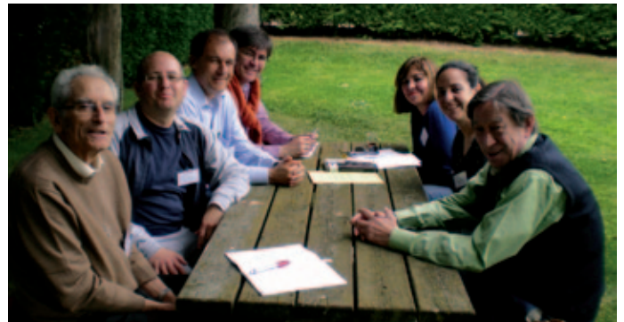
Grupo de trabajo durante el encuentro.

Hay que reconocer que el encuentro, celebrado en la casa Fray Luis de León, en Guadarrama (Madrid), el puente del primero de mayo, no tenía grandes objetivos. No se trataba de aprobar un documento, trazar un plan de acción u organizar un trabajo en común... Solo pretendía –¡nada menos pretendía!– que fraternos de Zaragoza y Madrid y miembros de CEMI, se reunieran, convivieran, charlaran, rieran, rezaran, celebraran y compartieran la forma en que viven su vida de fe en comunidad. Lo hicieron cerca de ciento cincuenta personas, contando los niños, y estuvieron acompañados por