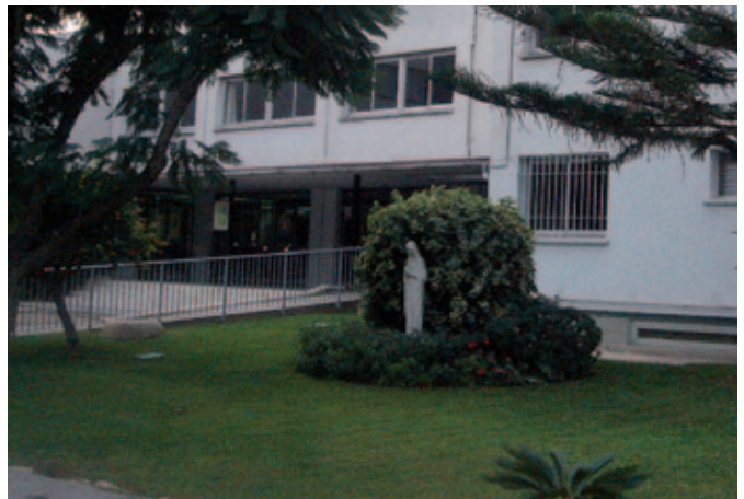
Colegio de Alboraya (Valencia), de las Hijas de María Inmaculada.

Todo esto se puede hacer, porque tenemos la suerte de disponer de un claustro de profesores comprometido con la idea de ser testigos del mensaje de Jesús. También gracias a las familias que, queriendo lo mejor para la educación de sus hijos, colaboran en las actividades que proponemos. Hemos compartido eucaristías, oraciones de encuentro, reflexiones, campañas solidarias... Al final, lo que nos tiene que quedar es la satisfacción de intentar cons-