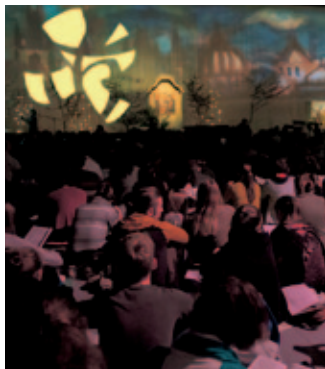
Oración en Taizé.

Son jóvenes que pertenecen a distintas iglesias cristianas, algunos creyentes y otros en búsqueda, pero todos abiertos a lo inesperado del Espíritu.