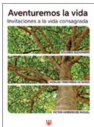
AA.VV., Aventuremos la vida. Invitaciones a la vida consagrada. Madrid, PPC, 2015, 207 páginas.