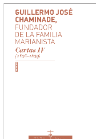
GUILLERMO JOSÉ CHAMINADE, FUNDADOR DE LA FAMILIA MARIANISTA. Cartas IV (1836-1839). Madrid, SPM, 2015, 661 páginas.

implicado en la vida de la Iglesia y de sus institutos. Pueden sorprender algunos usos y costumbres de vida religiosa, muy alejados de nuestra sensibilidad, pero destaca siempre su tendencia a la moderación, su realismo y su profundidad espiritual. Son años de expansión y dificultades con la primera obra fuera de Francia (Friburgo, Suiza) y ya se van juntando las nubes que llenarán de tinieblas y dolor los últimos años del Fundador, pero en este cuarto tomo de la voluminosa correspondencia chaminadiana hay auténticos tesoros.