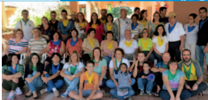
Fiesta de celebración de los cuarenta años.

En Bauru, en el territorio de la parroquia, construimos el centro educativo “Caná”, para acoger y ayudar a los chiquillos de Ferradura Mirim, una favela que está dentro del territorio de la parroquia.