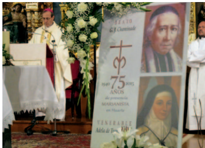
El arzobispo, junto al cartel conmemorativo de los 75 años.

Celebrar setenta y cinco años de historia nos ayuda a agradecer y mirar la vida a través de las personas que, de generación en generación, han recorrido estos años. ¿Cómo no reconocer hoy la acción del Señor y proclamar como María: Magnífica! ?