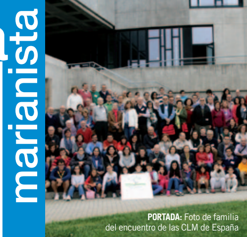
PORTADA: Foto de familia del encuentro de las CLM de España

Por lo demás, la revista mantiene sus secciones fijas de reflexión, recensión de libros y oración, así como algunas nuevas iniciativas sobre pastoral.