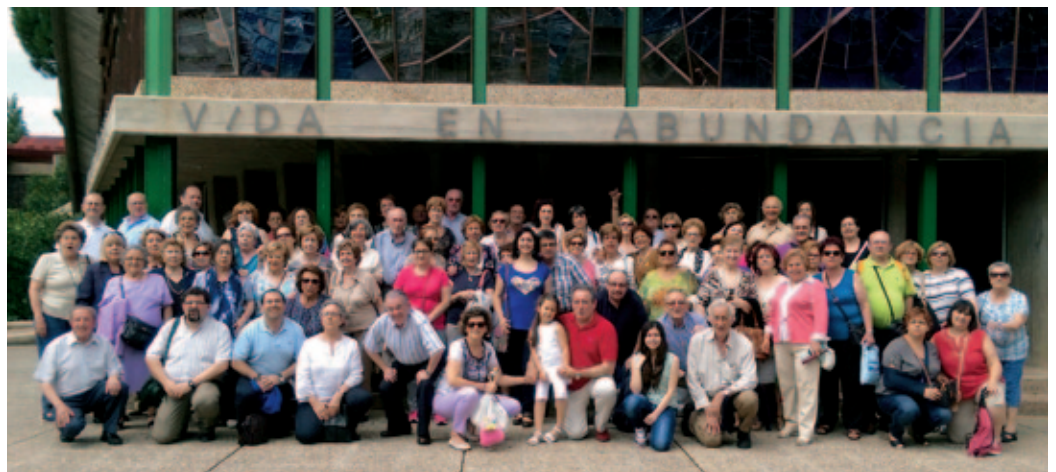
Peregrinación a Zaragoza de las comunidades parroquiales marianistas de Madrid.

Las tres comunidades tenemos una misión común: encender la llama de la fe en el corazón de nuestra gente desde el carisma marianista. Juntos queremos ayudarnos a responder a los nuevos desafíos de nuestro tiempo.