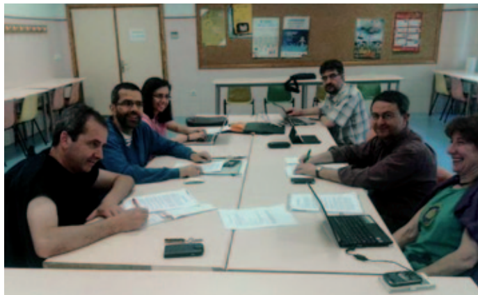
Reunión del equipo promotor de los DPJ

El equipo promotor se reúne tres veces al año, fijando previamente una temática de reflexión, sobre la cual un