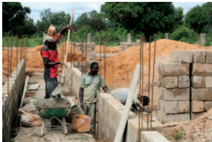
Obras de ampliación del colegio Chaminade en Benín.

Desde sus inicios Acción marianista ha colaborado en la construcción de un internado para jóvenes de 10 a 18 años. La fase inicial del proyecto albergaba plazas para 72 alumnos. En esta segunda