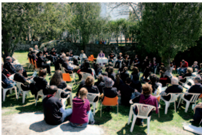
Eucaristía en Zarzalejo (Madrid).

Frutos de este proyecto son algunas iniciativas que ya nos dan vida: los encuentros en Betania de profesores en la comunidad marianista, la oración mensual de Taizé, la eucaristía del domingo por la noche orientada a los jóvenes ( Stam-papps ),... Somos conscientes de que hemos trazado un plan ambicioso. Con humildad, reconocemos nuestras limitaciones y dificultades y percibimos que estamos en los comienzos. Pero también nos damos cuenta de que no nos falta la alegría ni la voluntad de muchas personas que han decidido acoger este regalo de Dios que es la Comunidad de Fe SMP y poner en él todas sus energías.