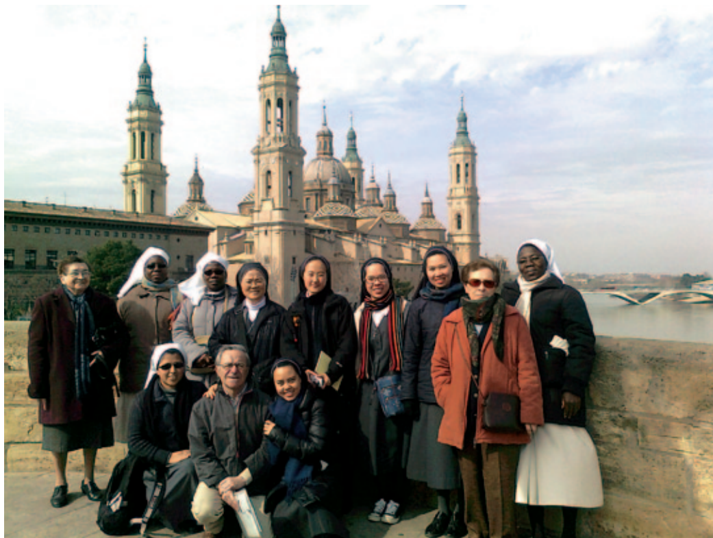
Las participantes en el programa en su peregrinación a la basilica del Pilar, en Zaragoza.

ESTE AÑO HEMOS DADO INICIO AL PRIMER GRUPO DE HERMANAS JÓVENES QUE PARTICIPAN EN EL PROGRAMA DE PREPARACIÓN PARA LOS VOTOS PERPETUOS. EL CURSO COMENZÓ EL 16 DE ENERO Y DURARÁ HASTA EL 16 DE JUNIO. ES LA PRIMERA VEZ QUE NOS AVENTURAMOS EN UNA EXPERIENCIA TAN LARGA Y TAN INTENSA.