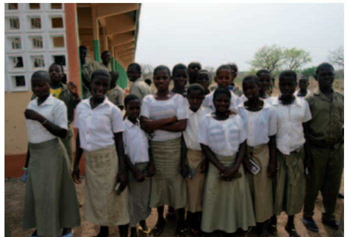
Alumnas del Colegio Adèle en Kara.

El colegio ha dispuesto de un comedor para los 250 alumnos (internos o no). Este es un hecho motivador para los padres a la hora de enviar a los niños y niñas al colegio, pues en muchos de los casos es la única fuente de alimentación nutritiva que tienen al día.