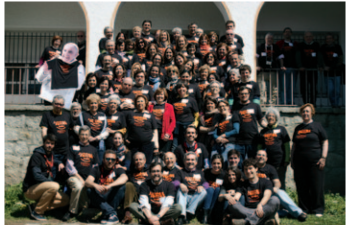
Las participantes en el programa en su peregrinación a la basílica del Pilar, en Zaragoza.

Nos empujó a ello la propuesta y el desafío lanzado por la nueva Provincia Marianista de España de tomar como paradigma de nuestra presencia y acción misionera el lugar Madeleine : aquella iglesia de Burdeos que Chaminade convirtió en el corazón mismo de su proyecto a la vuelta de Zaragoza en 1800. Al tiempo, el colegio era invitado a elaborar un nuevo proyecto pastoral. Y entonces vimos la ocasión providencial: ¿y si comenzábamos a soñar un futuro pastoral para una única comunidad, caminando unidos y elaborando un solo proyecto? Y esa fue la propuesta que lanzamos a los agentes de pastoral de Santa María.