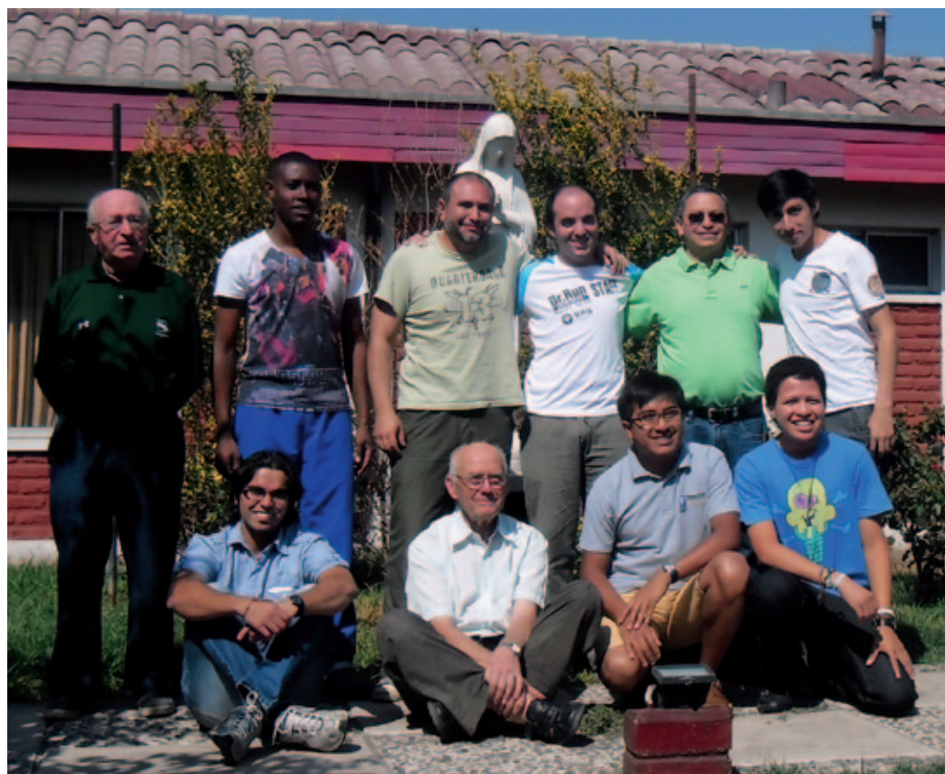
La comunidad del Noviciado.

LA COMUNIDAD “NUESTRA SEÑORA DE GUADALUPE” ES UNA CASA DE FORMACIÓN DE LA COMPAÑÍA DE MARÍA, CUYA FINALIDAD ES RESPONDER A LO QUE LA GUÍA DE FORMACIÓN PIDE PARA LA ETAPA DEL NOVICIADO. ESTÁ EN SANTIAGO DE CHILE.