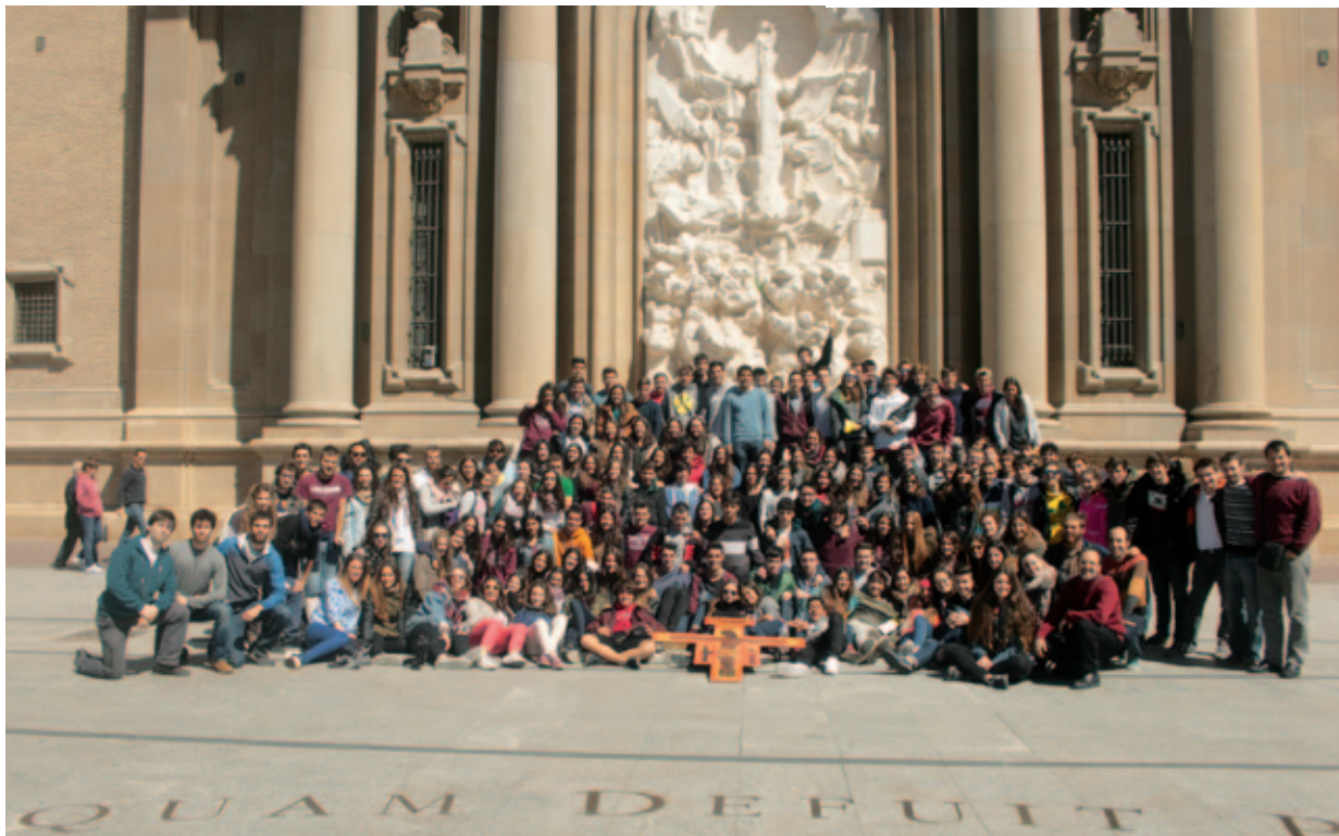
Participantes de la Pascua Joven en el Pilar de Zaragoza.