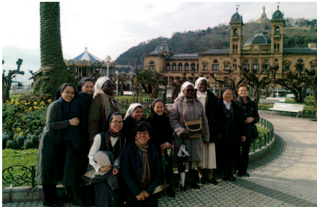
Visita a San Sebastián de las religiosas de la Comunidad de Agen.

También se están realizando peregrinaciones a los lugares fundacionales marianistas: