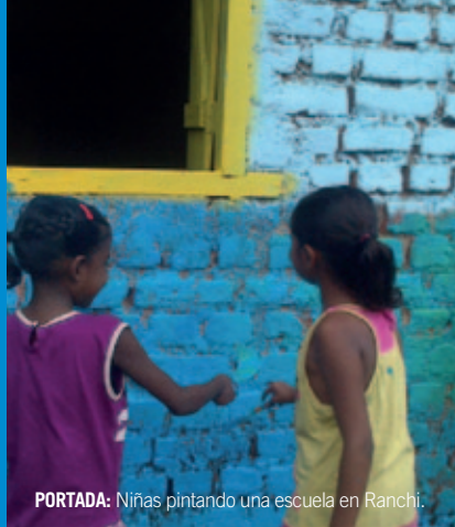
PORTADA: Niñas pintando una escuela en Rancho.