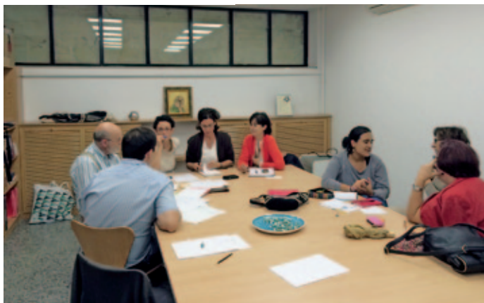
Reunión preparatoria de la Asamblea.

Como dice el Eclesiastes, hay un tiempo para cada cosa, un momento para cada tema. Y esto es lo que ocurre en la Región de Madrid de las Fraternidades Marianistas de Madrid. En junio de 2014 hubo una Asamblea regional para la elección de un nuevo Responsable Regional. Finalmente no hubo candidatos a la votación, quedando vacante este puesto por primera vez. Esto ha provocado un periodo de reflexión entre los Responsables de las Fraternidades y el Equipo de coordinación, que ha dirigido en el Consejo Regional. Un trabajo duro y creativo en varias reuniones y encuentros, que se cristalizó en una Asamblea ordinaria (25 de octubre de 2014) y otra extraordinaria (a mitad de diciembre de 2014) con el objetivo en esta última de votar a un nuevo Responsable. No sabemos cuál será el resultado, pero lo que pudo ser una «decepción» se ha convertido en una oportunidad. Después de más de treinta años de vida de las Fraternidades, los caminos toman nuevos rumbos, pero con la certeza que María y Jesús nos acompañan en ello.