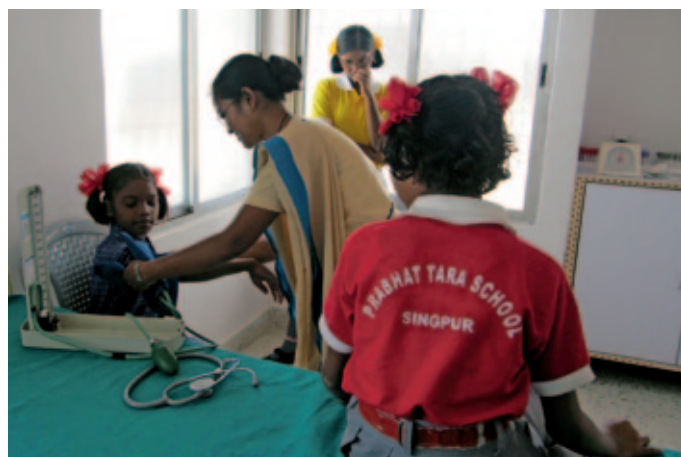
Hermana marianista asistiendo a una niña en el centro médico de Ranchi.

Los hermanos marianistas de India cuentan también con el apoyo de la Fundación Fratelli Dimenticati Onlus de Italia desde 1997 y están pre-