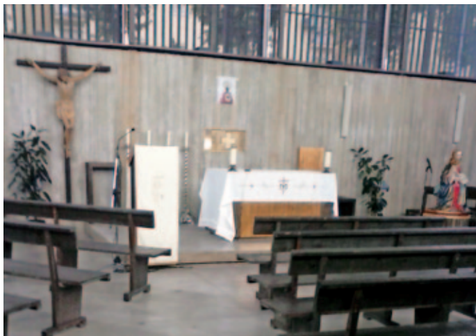
Capilla del nuevo colegio de Ciudad Real.

El sábado 20 se tuvo el acto oficial de inauguración. Ya en la nueva capilla presidió