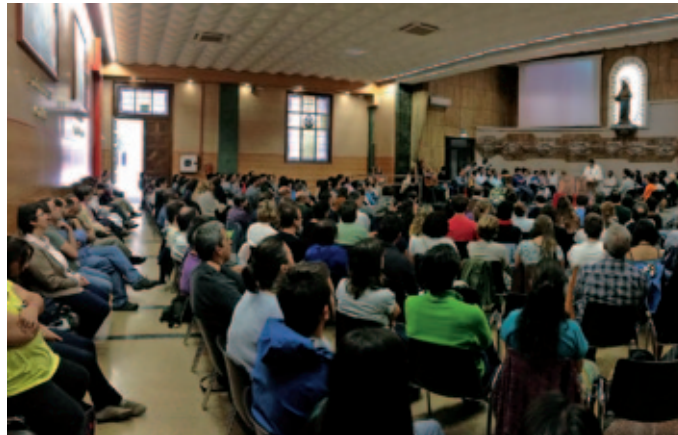
Celebración eucarística final.

La guinda final llegó el domingo, con la invitación a formar parte de un sueño: la Revolución de la Ternura . Esto vino de la mano de un grupo de veinte jóvenes (dos de cada institución organizadora) que, tras varios meses de preparación, tomaron la palabra y escenificaron con asombrosa frescura y creatividad las claves para una pastoral juvenil de la misericordia. Acabaron entregando a todos los participantes un sobrecito monodosis de Misericordin, crema reparadora y revitalizante para las arrugas del alma, especialmente indicada para todos aquellos que deseen convertirse en instrumentos de la misericordia regeneradora de Dios. El simpático prospecto que venía con el sobrecito especificaba,