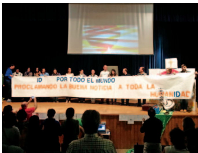
Invitación a participar en la Revolución de la Ternura.

Por la tarde, los participantes pudieron expresar la misericordia en tres talleres que les adentraban en las Sagradas Escrituras, en el mundo de la imagen y en los lenguajes juveniles. También pudieron experimentar la misericordia en otros tres talleres: viéndola como camino para crecer en el autoconocimiento, meditando sobre la experiencia del sufrimiento tanto propio como ajeno, y conociendo de primera mano el testimonio de víctimas que viven reconciliados y reconstruidos. Finalmente, los talleres sobre el arte de sanar a las personas, sobre los jóvenes sin trabajo en un mundo en cri-