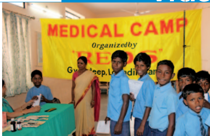
Niños esperando para el chequeo médico en Ranchi.

sentando los proyectos a la Administración pública india, para optar a subvenciones que, junto con el apoyo de la Compañía de María, facilitan la sostenibilidad del proyecto.