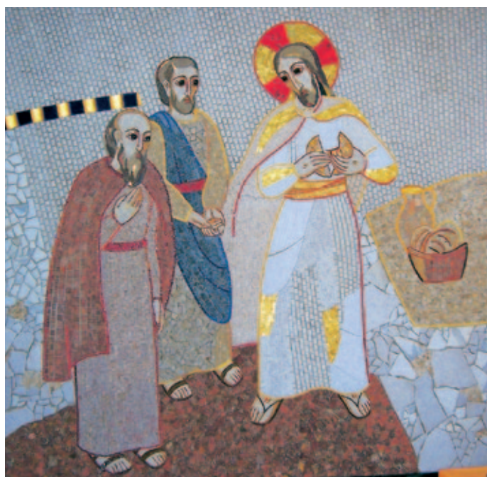
El pan partido en Emaús. M. I. Rupnik. Catedral de la Almudena (Madrid).

La «Experiencia Emaús» propone un itinerario espiritual siguiendo la espiritua-