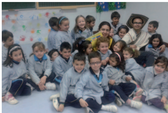
En el colegio marianista de Valladolid.

Desde AM valoramos esta experiencia de forma muy positiva, pues en ella diferentes delegaciones y colegios participaron en la gestión y organización de este intercambio fructífero y enriquecedor para todas las partes.