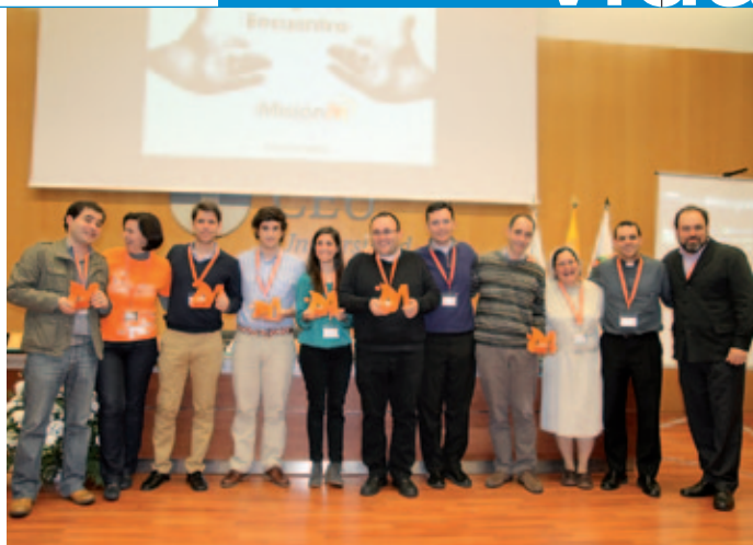
Grupo de participantes en el Congreso iMisión.

en Twitter, ayudarles a encontrarse y formarse mejor. Veíamos muy claro que en un futuro próximo debíamos celebrar un congreso, que pudiera impulsar en la Iglesia española una actitud positiva ante el reto de la nueva evangelización en el tiempo de la red, y con la gracia de Dios así ha sido. Una vez que tuvimos claros los objetivos, buscamos un nombre, pedimos sugerencias en Twitter y votamos, salió iMisión (Misión en Internet). Después Xiskya y yo llamamos a la puerta de algunas personas para proponerles sumarse al proyecto. Constituimos un staff de siete personas. Nos dejamos el verano para reposar todo y hablar con nuestros superiores (los que éramos religiosos/sacerdotes). En septiembre de 2012 se puso todo en marcha. Poco después, en diciembre de 2012, habíamos armado tanto lío que nos convocó a una entrevista en Roma mons. Celli, Presidente del Pontificio Consejo para las Comunicaciones Sociales, el cual bendijo y dio un impulso tremendo al proyecto. Desde entonces no dejamos de crecer, en número de colaboradores directos, seguidores en Facebook y Twitter, y con todo esto fuimos tejendo la primera red de evangelizadores en internet que se ha hecho en el mundo de habla hispana.