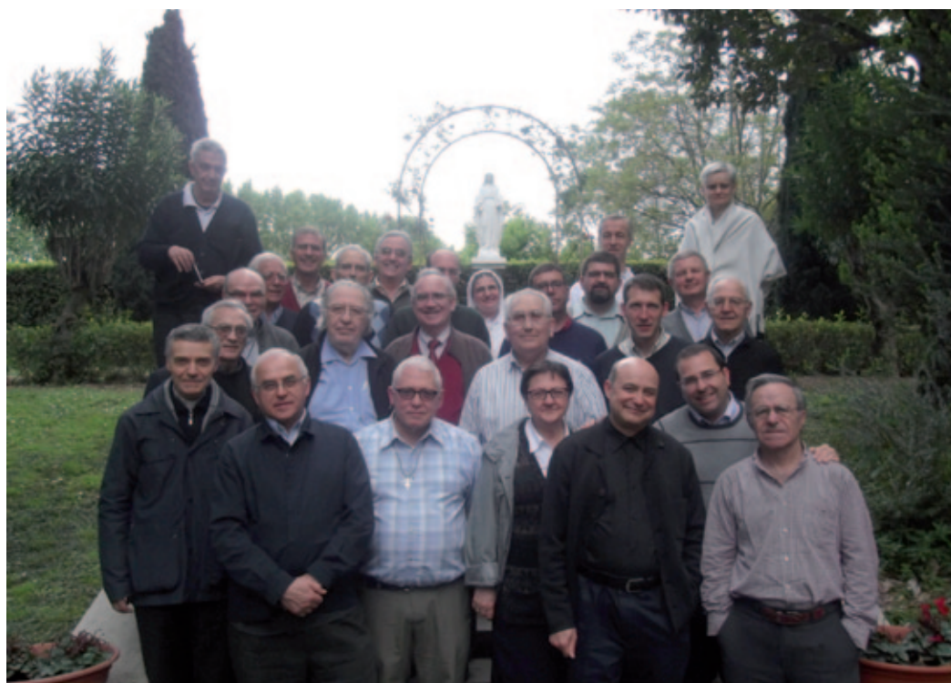
Participantes en el Simposium de Roma.

“...fueron aflorando temas centrales y comunes: la necesidad de un nuevo lenguaje, la importancia de la educación, la comunidad como ámbito y sujeto del acto de creer, el papel central de la formación para poder así responder al desafío de la increencia sin caer ni en el relativismo ni en el fundamentalismo...”