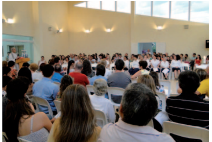
Celebración de la eucaristía con la familia marianista en el Centro Caná.

Siempre con el sueño de un “querido proyecto” donde se lograra dar una mayor visibilidad al carisma y aportar