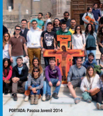
PORTADA: Pascua Juvenil 2014