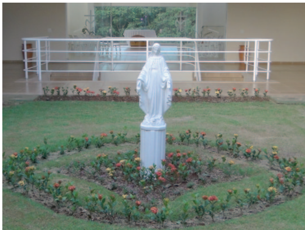
La estatua de la Virgen que preside el centro marianista de Caná.

Ellas creían que su llamada a la vida religiosa marianista era ante todo un don de Dios y que su respuesta había brotado del contacto con el carisma.