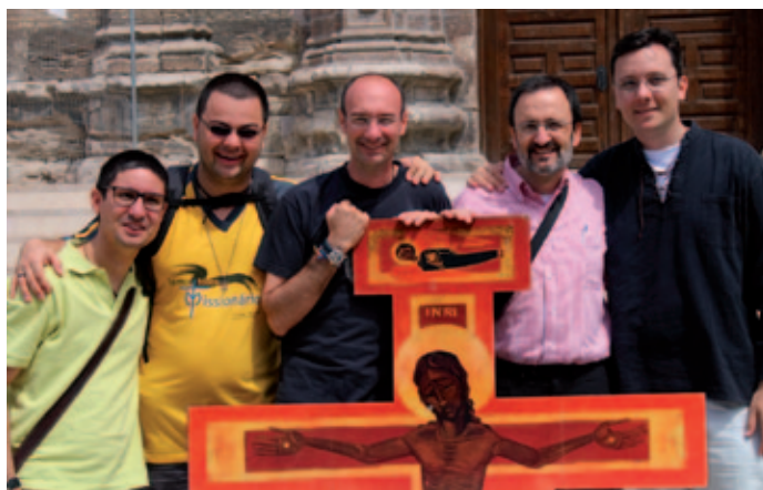
Organizadores de la Pascua Juvenil.

No cabe duda de que la singular belleza del templo del colegio ha ayudado a que los momentos de oración y celebración hayan sido tan