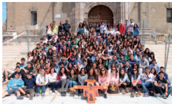
Participantes en la Pascua Juvenil, en Zaragoza.

intensos. También ayudan los amplios espacios del cuidado recinto escolar. La visita al Pilar es también un aliciente, claro. Pero, como sucede siempre, la mayor ayuda viene de las personas. Y, del mismo modo que durante años la comunidad marianista de Logroño ha sido pilar indispensable de la pascua con su servicialidad, este año tenemos que reconocer con gratitud que la ayuda constante tanto de los religiosos como del personal del colegio nos han puesto las cosas muy fáciles.