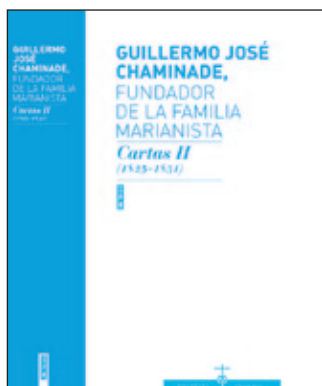
GUILLERMO JOSÉ CHAMINADE, CARTAS II (1825-1831). Madrid, SPM, 2013, 816 páginas.

Con el auge de los chats , los twits y los wassap , el noble arte de escribir una carta está cayendo en desuso. No fue así en otros tiempos: desde las cartas de san Pablo hasta hace bien poco el género epistolar ha sido uno de los preferidos para transmitir la fe y la experiencia cristianas. Presentamos hoy dos libros muy distintos de envergadura, época y estilo, pero coincidentes en que son sendos ejercicios de paternidad espiritual en forma de cartas. El volumen II de las Cartas del beato Guillermo José Chaminade recoge muchos trazos de vida de un fundador que seguía con gran interés el lento pero imparable desarrollo de las Hijas de María y la Compañía de María. El libro de Jorge Mario Bergoglio/Francisco recoge las cartas que el entonces arzobispo de Buenos Aires dirigía anualmente a sus catequistas. En ambos casos, frente a una “paternidad a la carta” estamos ante una bella y elocuente prueba de cómo se ejerce la auténtica paternidad espiritual, la que sabe acompañar en la fe, formar e interpelar.