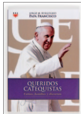
JORGE MARIO BERGOGLIO / PAPA FRANCISCO, Queridos catequistas. Cartas, homilias y discursos. Madrid, PPC, 2013, 95 páginas.

lebrativa. Muchas de las ideas que luego hemos encontrado en la exhortación Evangelii gaudium ya están presentes en estos trece documentos. Creemos que es un óptimo material para trabajar no solo en grupos de catequistas de parroquias y colegios, sino en equipos de pastoral o incluso en Comunidades Laicas Marianistas. Lo que Francisco plantea a los catequistas vale para todos los creyentes que quieran apasionarse por la nueva evangelización.