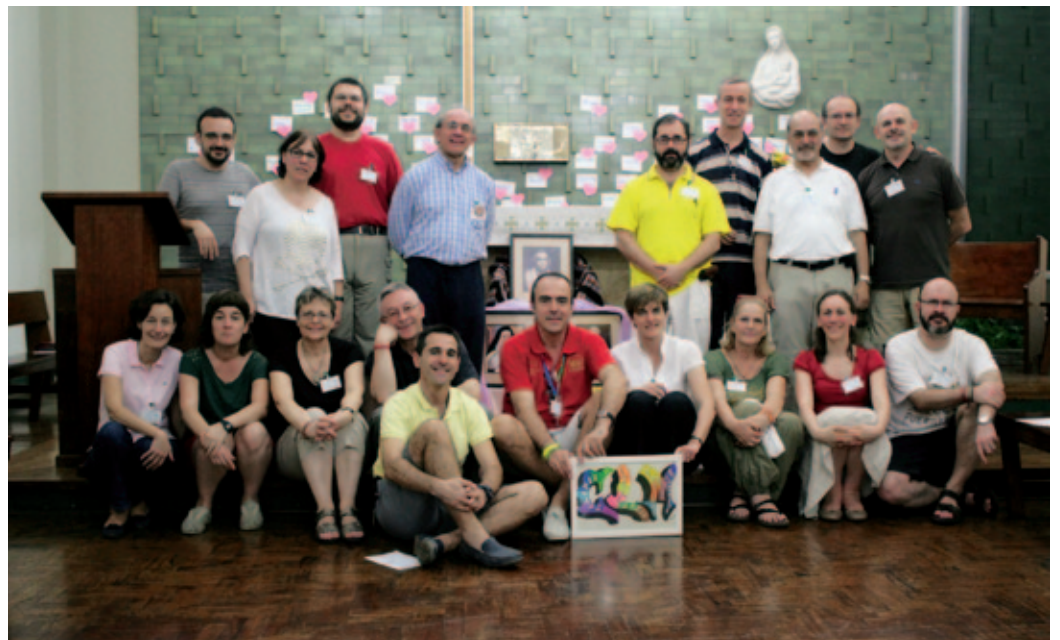
Algunos de los participantes en el Encuentro.