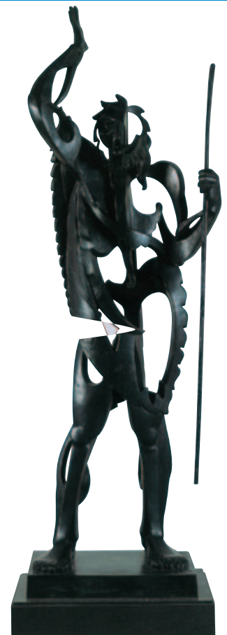
El profeta. Gargallo.

Hay que confesar a Dios en la vida pública. Dios, con su intervención concreta, con su presencia entre nosotros, confiesa públicamente su deseo de dar consistencia a las relaciones humanas. No debemos tener reparos en proponer la grandeza de la vida común que él hace posible. La fe ilumina la vida en sociedad: poniendo todos