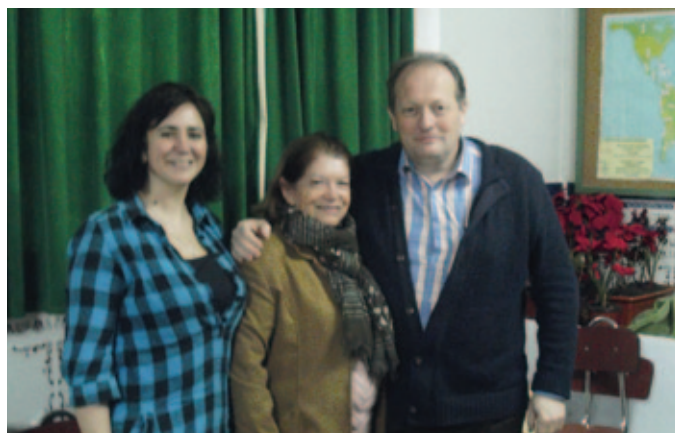
Grupo de Caritas de la parroquia de Orcasur.

modesta pero alegre. El espíritu marianista lleva cuarenta y nueve años queriendo hacerse amigo y compañero de camino de esta porción del pueblo de Dios: ovejas cansadas algunas, otras heridas, otras agresivas, pero todas deseosas de colmar su sed profunda de felicidad y plenitud, que sabemos solo pueden encontrar en Jesús.