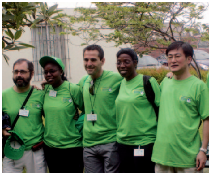
Unas CLM muy internacionales.

Hemos rezado juntos, en muchos idiomas, con muchas sensibilidades. La comunidad parroquial de El Callao, una parroquia marianista en un barrio de la periferia de Lima, nos dio un ejemplo glorioso de acogida, alegría en la celebración de la fe y del compartir. Sin duda nuestro encuentro con la gente humilde del barrio fue un encuentro real con los ele-