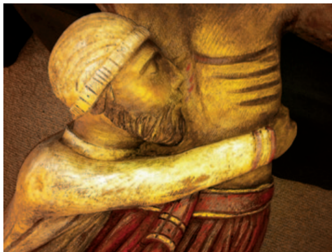
Imagen de Nicodemo abrazando el pecho de Jesús.

teriores y han aumentado los profesores jóvenes, de reciente incorporación.