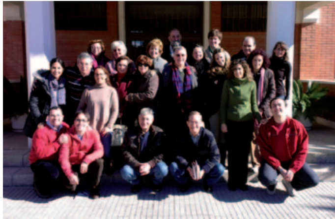
Participantes en los Ejercicios Espirituales en Madrid.

Las Fraternidades de Madrid, en sus dos regiones, Madrid-Centro (Madrid y Valladolid) y Sur (Jerez de la Frontera y Cádiz) siguen su habitual día a día, compuesto de muchos pequeños y grandes momentos. El pasado 26 de enero de 2013, en la Administración Provincial de los religiosos marianistas de España, en Madrid, se reunió