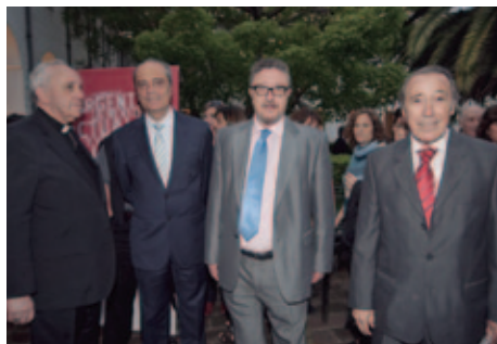
El cardenal Bergoglio en la presentación de Vida Nueva Cono Sur el 24 de octubre de 2012.

El hasta hace poco cardenal Jorge Mario Bergoglio no es una figura ajena a los marianistas, con los que ha tenido diversos contactos como presidente de la Conferencia episcopal argentina y como arzobispo de Buenos Aires. Recientemente, en octubre del 2012, con motivo de la presentación de Vida Nueva Cono Sur , el arzobispo de Buenos Aires tuvo unas palabras de aliento y de reflexión ante la nueva publicación. ¡Bienhallado, Francisco!