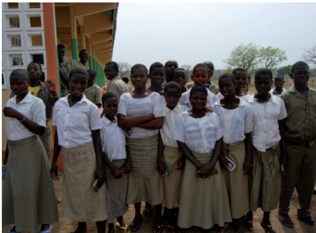
Alumnas del internado de Kpatchilé.

Esta casa de acogida para jóvenes, podría tener un impacto positivo además en la lucha contra el matrimonio forzado. Las chicas se animarían a continuar su promoción, si tienen un lugar donde acogerse.