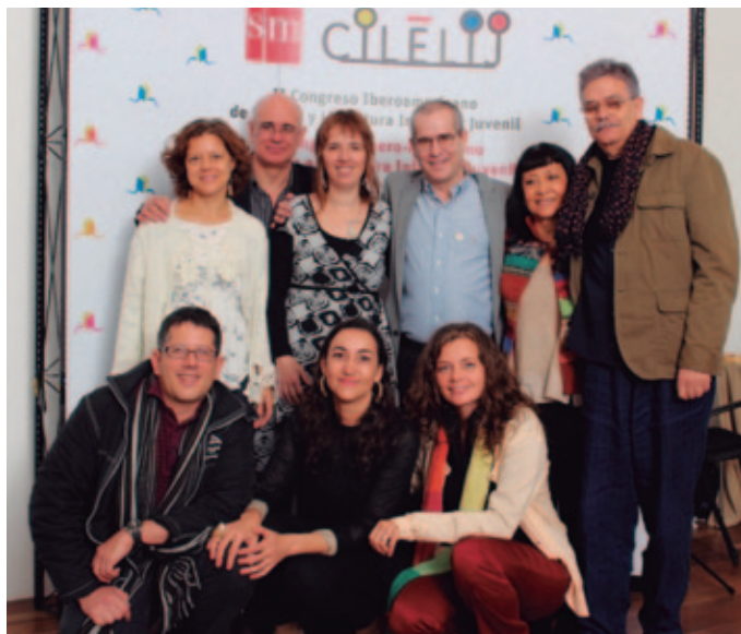
Algunos de los participantes al congreso.

ENTRE LOS DÍAS 5 Y 9 DE MARZO SE HA CELBRADO EN BOGOTÁ LA SEGUNDA EDICIÓN DEL CONGRESO IBEROAMERICANO DE LENGUA Y LITERATURA INFANTIL Y JUVENIL (CILELIJ) EN EL QUE, BAJO EL LEMA ESCRIBIR, ILUSTRAR Y LEER LIBROS INFANTILES Y JUVENILES HOY EN IBEROAMÉRICA , MÁS DE 50 PONENTES ABORDARON ANTE 600 ASISTENTES LA SITUACIÓN ACTUAL DE LA LITERATURA PARA NIÑOS Y JÓVENES.