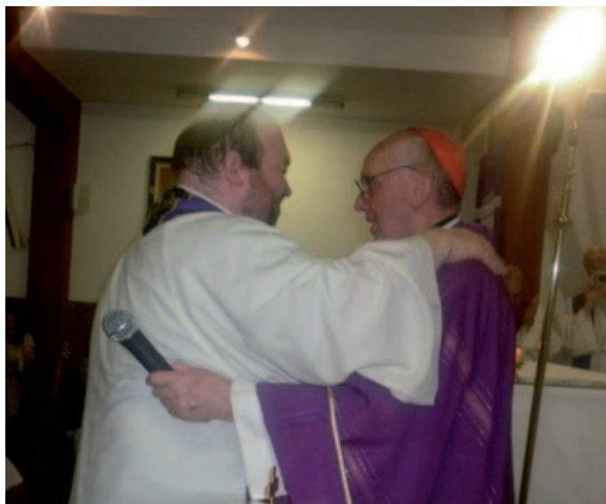
Abrazo de con Bergoglio en la misa de traspaso de la Obra de Fátima.

Sentados frente al televisor esperábamos que saliera en cualquier momento el nuevo Papa. Iban ya pasando los minutos desde la fumata blanca. Los periodistas internacionales se inclinaban por el cardenal Scola. Y entre comentarios poco optimistas nos vino la pregunta: “¿Y si saliera Bergoglio?” “La otra vez parece que estuvo segundo”. “Pero ahora ya tiene 76 años y su salud no siempre le acompaña”. “¿Y si saliera Bergoglio?” “Sería un signo que un tiempo nuevo comienza en la Iglesia”... En ese momento se abrió la puerta del balcón central de la basílica de San Pedro y llegó el esperado anuncio. En pocos segundos al nombre de Jorge