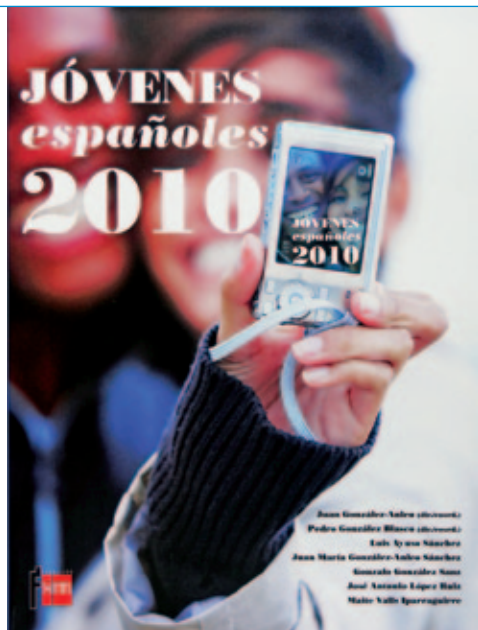
El último informe sobre la juventud española.

seguían presentes, cuando intentamos cerrar lo que será tu obra póstuma en la Fundación SM sobre Jóvenes inmigrantes en España .