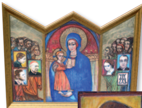
Tríptico de la Virgen.

Además del Consejo, la vida en las zonas de cada región sigue sus caminos: ejercicios espirituales, tan necesarios para nuestro crecimiento en la fe y personal, los encuentros de zona, las reuniones de cada fraternidad, la formación, las delegaciones de Acción marianista, las eucaristías en familia (en Madrid), participación en pastoral y catequesis, etc. En este periodo es verdad que no se ha generado ninguna nueva fraternidad, pero se han incorporado hermanos jóvenes (menos de 30 años) a algunas fraternidades y por ello queremos dar a Dios.