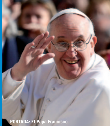
PORTADA: El Papa Francisco