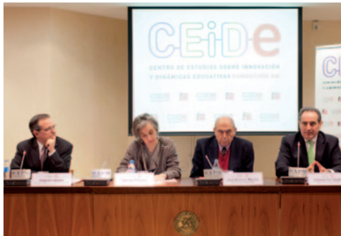
Presentación del CEIDE-FSM.

El CEIDE-FSM nace con la vocación de convertirse en un espacio de referencia para todos aquellos agentes sociales vinculados y preocupados por la educación. En él se podrá encontrar información y reflexiones acerca de los cambios a los que está asistiendo la escuela en nuestros días.