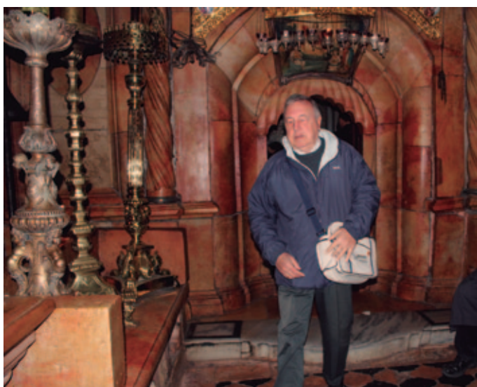
Su último viaje. En el sepulcro de Jesús.