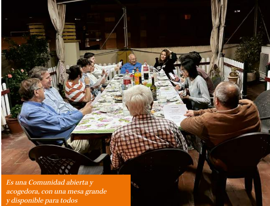
Es una Comunidad abierta y acogedora, con una mesa grande y disponible para todos

por eso nos llamamos MARIA DUCE, porque ninguno de nosotros sabe muy bien el camino que nos toca recorrer. Con María como guía y Dios Padre, haciendo en nosotros, sabemos que nada puede salir mal. La oración, la eucaristía, el discernimiento y una agradable cena en familia, ha dado lugar a una comunidad entrañable y alegre, donde cada uno se puede expresar con libertad, donde se nota el amor cristiano, el deseo de ayudarnos unos a otros y el estar totalmente dispuestos a darnos en la misión que Dios ha elegido para nosotros. La visión establecida hace unos años por el Consejo Parroquial: "una parroquia a imagen de la familia de Nazaret; acogedora, unida, fuerte en la fe, solidaria, misionera y constructora del Reino" ha resultado ser el punto de referencia hacia donde caminar.