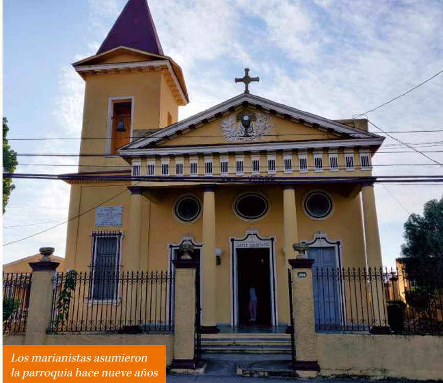
Los marianistas asumieron la parroquia hace nueve años

Me estrené con el famoso ciclón. Tuve que iniciar las obras del tejado de la cubierta de la Iglesia. Aquí las cosas van muy despacio. He tenido que ejercitar la paciencia: "esto es Cuba, Padre" No es fácil conseguir cemento; cuando lo tienes hay que esperar la tela asfáltica y luego tienes que conseguir la arena y tiene que venir el equipo de albañiles que no vienen y finalmente los dineros.