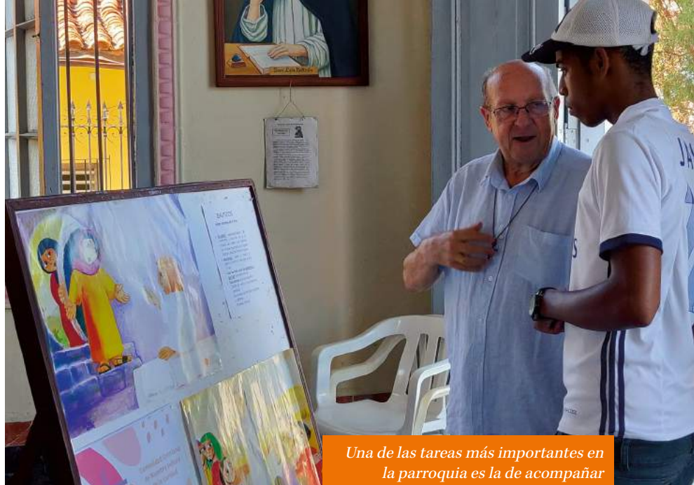
Una de las tareas m6s importantes en la parroquia es la de acompa6ar

Se ha creado una comisi6n con tres miembros del Consejo parroquial. Hemos dado los primeros pasos: entrevista con el obispo que va a declarar a esta iglesia, santuario de la Caridad del Cobre ya que el original est6 muy distante en el oeste de la isla. Hemos empezado los domingos con una oraci6n para que la gente se vaya motivando, vamos a colocar en el frontis de la Iglesia el lema que lo hemos sacado de la oraci6n: "Cien a6os que Mar6a tiene su casa en Pinar". Se va a organizar un concurso de artes pl6sticas. En el mes de junio cada semana va a haber un acto de tipo cultural, hist6rico, art6stico, musical, que vaya ambientando esta celebraci6n. En septiembre ser6 la novena de la Caridad del Cobre animada cada