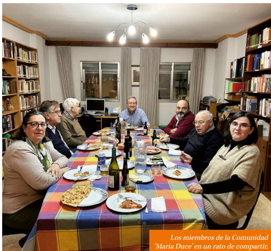
Los miembros de la Comunidad 'María Duce' en un rato de compartir.