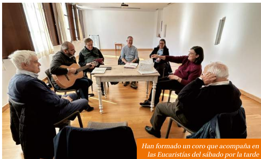
Han formado un coro que acompaña en las Eucaristías del sábado por la tarde

reunirse y llevar a cabo sus actividades), pero no conocíamos a los sacerdotes y religiosos ni a sus parroquianos. Pero cuando el Espíritu sopla, te lleva donde quiere y nosotros nos dejamos hacer y llevar. Formamos la comunidad y decidimos que era María quien debía dirigir nuestros pasos y