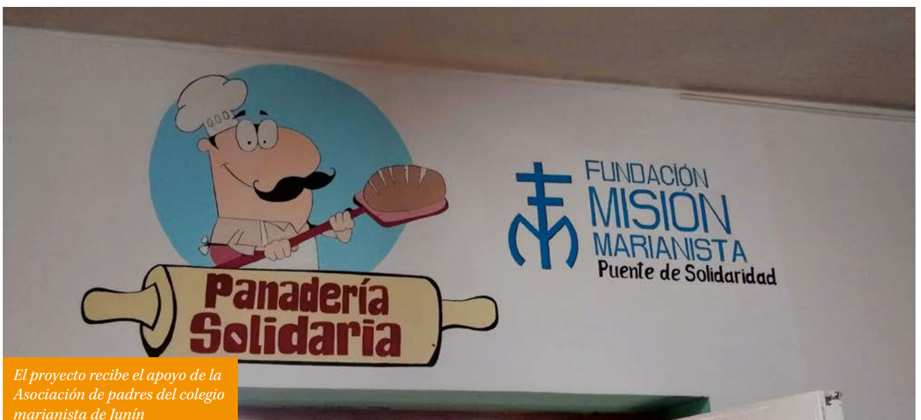
El proyecto recibe el apoyo de la Asociación de padres del colegio marianista de Junín

Es un ejemplo maravilloso de trabajo conjunto y solidario entre la comunidad local (asociación de padres de alumnos, equipo de psicólogos, tallerista docente, el grupo de internos) y las distintas instituciones intervinientes (Instituciones Penitenciarias, Comedores sociales, Asilos de ancianos, Fundación Misión Marianista...).