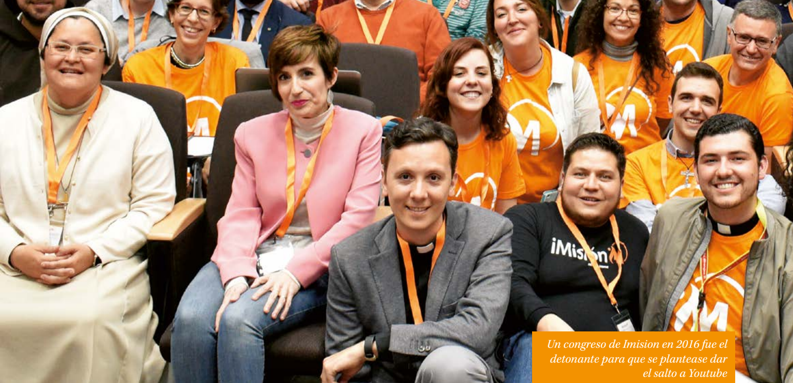
Un congreso de Imision en 2016 fue el detonante para que se plantease dar el salto a Youtube

P.- ¿A quién te querías dirigir? ¿Por qué?