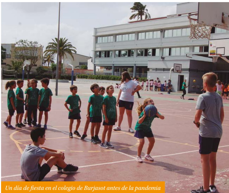
Un día de fiesta en el colegio de Burjasot antes de la pandemia

Vale la pena transcribir algunos párrafos del documento inicial de trabajo de esta comisión: “El proyecto de integración de los colegios de las Hijas de María Inmaculada en España dentro de la Red de colegios marianistas de España se produce dentro de un marco que conviene destacar. Es importante partir del hecho que tanto las FMI como la Red de colegios somos miembros de la misma familia, la Familia Marianista con una misión educativa común que parte del carisma y la identidad del Padre Chaminade y Adela de Trenquellón. La unión de los colegios es una buena oportunidad para visibilizarlo (...) El hecho de que