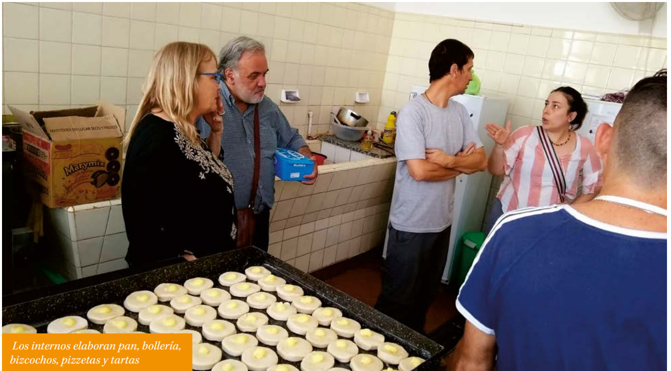
Los internos elaboran pan, bollería, bizcochos, pizzetas y tartas

Hay un porcentaje de población que vive de manera precaria, en zonas de viviendas que no poseen títulos de propiedad, ni servicios básicos como luz, gas, agua corriente o saneamiento. De este modo, personas mayores, niños sin hogar y familias empobrecidas de los suburbios de la ciudad, aproximadamente 5.000 personas al mes, reciben a diario (a través de entidades que trabajan con ellos), los alimentos preparados en la panadería solidaria.