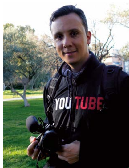
Por su labor pionera, recibió en 2018 el premio Bravo de comunicación de la Conferencia Episcopal

R.- Sí, recibo odio. No pensaba que en este camino los mayores haters iban a estar dentro de la Iglesia. Ha habido tres cosas que me han ayudado: el ver que la vida de Jesús es de permanente conflicto con los tradicionalistas; el odio desbocado que recibe el Papa; y mi comunidad, que me sostiene y me hace ver lo importante.