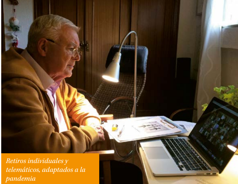
Retiros individuales y telemáticos, adaptados a la pandemia