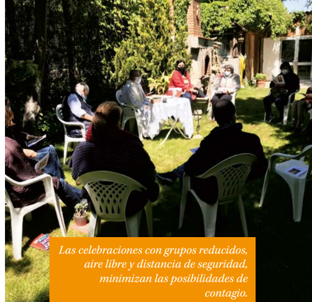
Las celebraciones con grupos reducidos, aire libre y distancia de seguridad, minimizan las posibilidades de contagio.

También en este 2021 las celebraciones de Cuaresma y Pascua han seguido viéndose afectadas por las restricciones que impone el desarrollo de la pandemia de COVID. Pero no por ello se han dejado de realizar retiros, oraciones y celebraciones, por medios telemáticos o cumpliendo escrupulosamente las restricciones sanitarias.