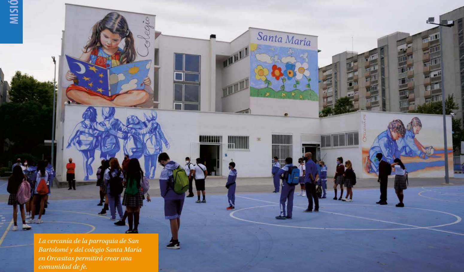
La cercanía de la parroquia de San Bartolomé y del colegio Santa María en Orcasitas permitirá crear una comunidad de fe.

Lógicamente, el cambio no se realizará todo de una vez, sino en varias fases, durante 4 años: